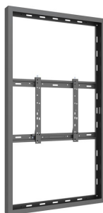
Gehäuse in Ihrer Größe